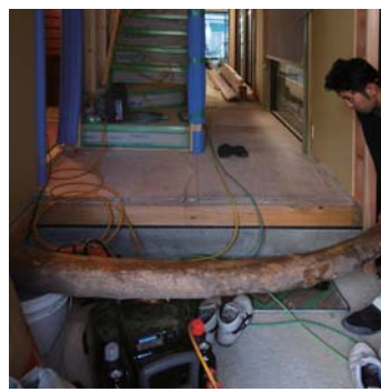
アテの木の玄関框