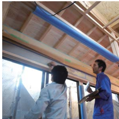
左官さんの塗り指導